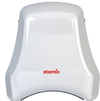
HÄNDETROCKNER AirStar T-C1 Mw