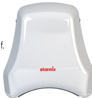
HAARTROCKNER AirStar TH-C1 Mw

Bestens geeignet für öffentliche Schwimmbäder. Glänzt durch geringe Betriebskosten und sorgt dank High-Speed Trocknung für zügigen Durchlauf. Optimal mit Höheneinstellung H-C1 M.