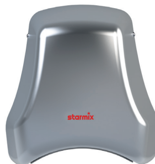
HÄNDETROCKNER AirStar T-C1 M

Für stark frequentierte Einrichtungen, bei denen es vor allem auf ein robustes Gerät ankommt. Bestens geeignet für Schulen, Sporthallen, Diskotheken, Gewerbebetriebe und alle öffentlichen Bereiche.