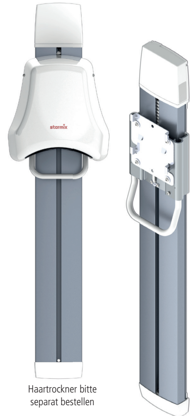
Haartrockner bitte separat bestellen